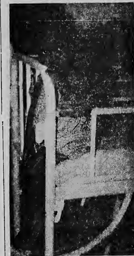
Un dje patientnan chikitu den e paviljon nobo pa muchanan di San Pedro Hospital, cual dia 8 di februari proximo lo ser inaugura oficialmente.